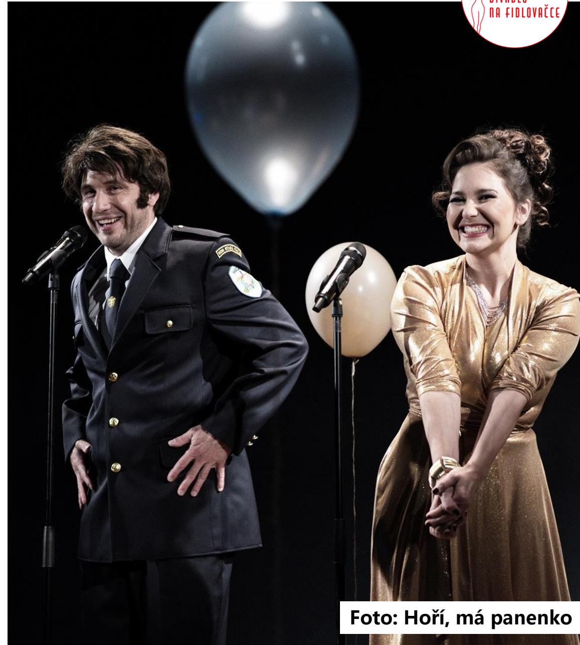
Foto: Hoří, má panenko